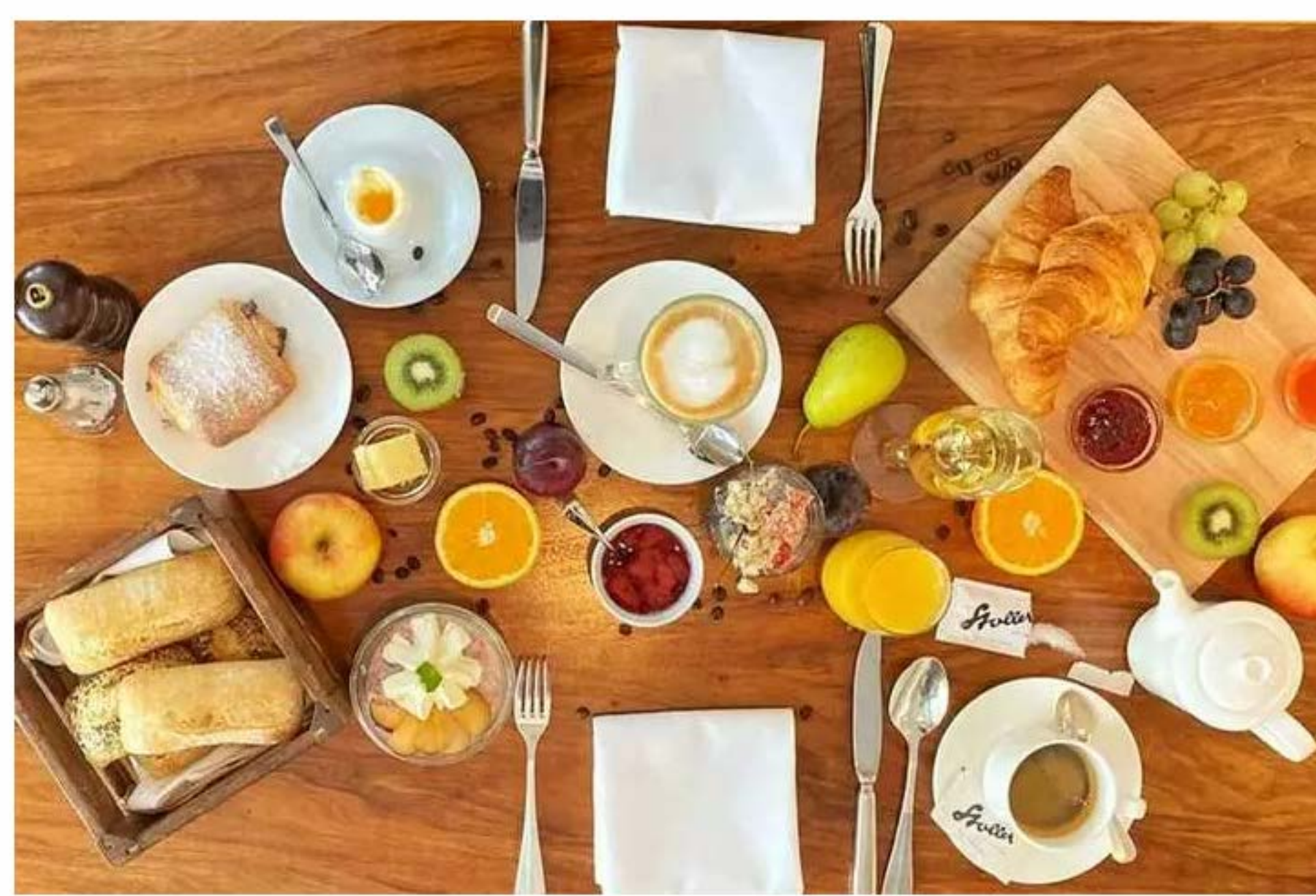
Das Restaurant «Stoller»

In Zürich konnte sich das «Stoller» an der Badenerstrasse im Kreis 3 durchsetzen: Das Restaurant wurde mit mehr als 20 Prozent zur beliebtesten Brunch-Location gewählt. Walter Stoller eröffnete das Café 1938 nach einigen Jahren in Italien. Heute, in der dritten Generation, ist das Lokal neben seinen hausgemachten Glace-Kreationen ein beliebter Frühstücks-Hotspot mit herzhaften à la Carte Brunch Gerichten.