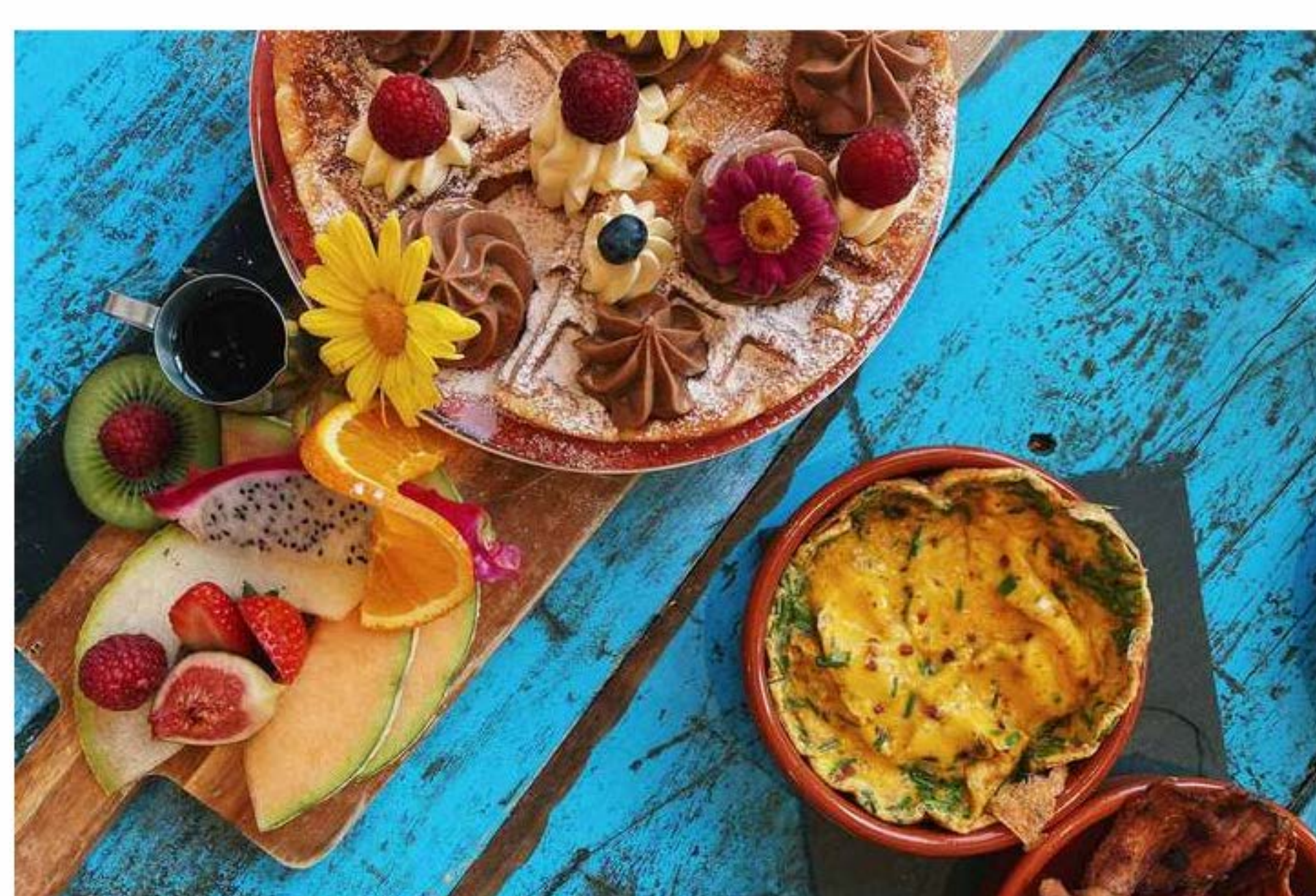
«Chez Anja»