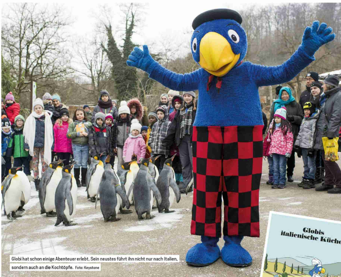
Globi hat schon einige Abenteuer erlebt. Sein neustes führt ihn nicht nur nach Italien, sondern auch an die Kochtöpfe.