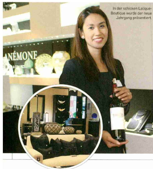
In der schicken Lique-Boutique wurde der neue Jahrgang präsentiert.

IMPORTEUR Rudolf Bindella, Zürich T: 044 276 60 60 www.bindella.ch , CHF 160,-