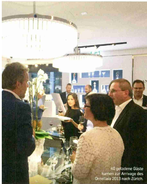
40 geladene Gäste kamen zur Arrivage des Ornellaia 2013 nach Zürich.