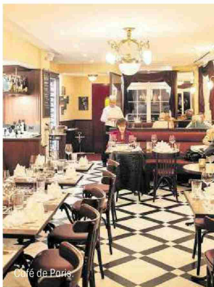
Café de Paris.