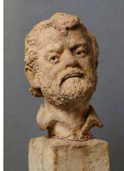
Sir James Galway